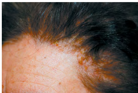
Рис. II-2-2. Контактный дерматит волосистой части кожи головы вследствие применения постоянного красителя (Alessandrini A., et al., 2016)

В одном из исследований была выполнена химическая оценка действительного содержания парафенилендиамина и ряда производных в красителях для волос, приведших к развитию аллергического контактного дерматита у 9 пациентов (Søsted H., et al., 2004). Установлено, что дерматит на краску для волос может возникнуть при